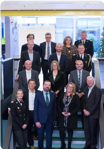
6 december 2016: de recente ondertekenaars

Werkgevers die diversiteit en inclusie beschouwen als meerwaarde voor het bereiken van bedrijfs- of organisatiedoelstellingen worden opgeroepen het Charter Diversiteit te ondertekenen. Het gaat hierbij om zowel commerciële bedrijven als non-profitinstellingen en (semi-)overheidsorganisaties. Met het tekenen van het Charter Diversiteit zeggen de bedrijven/organisaties toe zich te zullen inspannen voor een effectief diversiteitsbeleid. De door hen zelf gekozen maatregelen hebben tot doel om diversiteit en inclusie integraal op te nemen in de dagelijkse bedrijfsvoering.